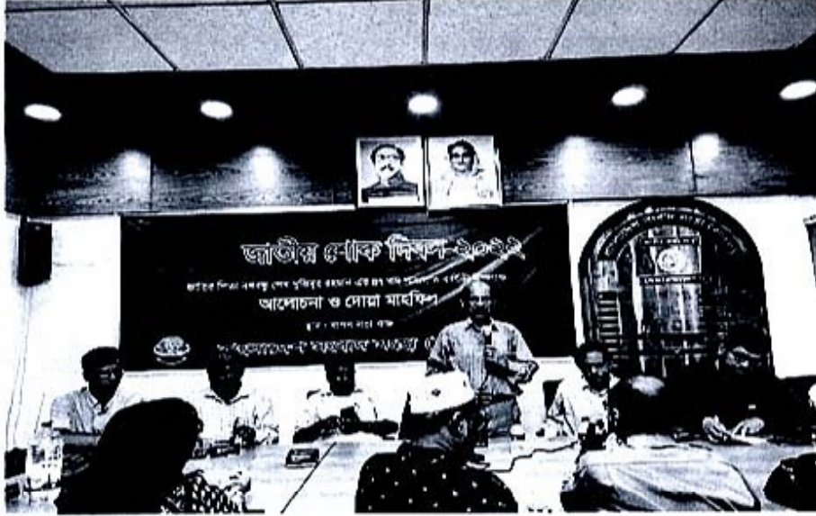
জাতীয় শোক দিবস-২০২২ উপলক্ষে আলোচনা ও দোয়া মাহফিল।

জাতীয় শোক দিবস পালন: ১৫ আগস্ট ২০২২ তারিখে জাতীয় শোক দিবস পালন করা হয়েছে। জাতীয় শোক দিবসে খানমন্ডি ৩২ নম্বরে সর্বকালের সর্বশ্রেষ্ঠ বাঙালি জাতির পিতা বঙ্গবন্ধু শেখ মুজিবুর রহমানের স্মৃতিস্তম্ভে সংস্থার সাংবাদিক, কর্মকর্তা/কর্মচারীদের শ্রদ্ধাঞ্জলি প্রদর্শন এবং বঙ্গবন্ধুর জীবনদর্শন সম্পর্কে আলোচনা সভা ও দোয়া মাহফিল আয়োজন করা হয়েছে। এছাড়াও 'শোকের মাস আগস্ট' শিরোনামে সংস্থার ওয়েবসাইটে বিশেষ ট্যাব চালু করে সংবাদ ও ছবি প্রদর্শন এবং বানার প্রদর্শন করা হয়েছে।