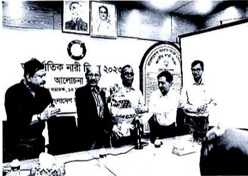
আন্তর্জাতিক নারী দিবস-২০২৩ উপলক্ষে আলোচনা সভা।

নারী দিবস পালন: আন্তর্জাতিক 'নারী দিবস' উপলক্ষে ১৩ মার্চ, ২০২৩ তারিখে তথা ও সম্প্রচার মহাশালার সচিব মহোদয়ের উপস্থিতিতে বাসস'র প্রধান কার্যালয়ে এক মতবিনিময় সভার আয়োজন করা হয়েছে।