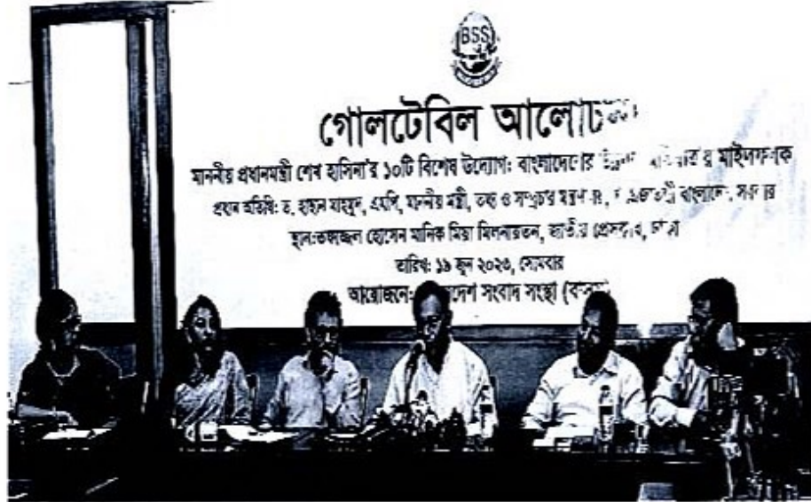
“মাননীয় প্রধানমন্ত্রী শেখ হাসিনার ১০টি বিশেষ উদ্যোগ: বাংলাদেশের উন্নয়ন অভিযাত্রায় মাইলফলক” শীর্ষক গোলটেবিল আলোচনা

১৯ জুন, ২০২৩ তারিখে তথ্য ও সম্প্রচার মন্ত্রণালয়ের মন্ত্রী মহোদয়ের সভাপতিত্বে জাতীয় প্রেস ক্লাবে “মাননীয় প্রধানমন্ত্রী শেখ হাসিনার ১০টি বিশেষ উদ্যোগ: বাংলাদেশের উন্নয়ন অভিযাত্রায় মাইলফলক” শীর্ষক গোলটেবিল আলোচনা সভার আয়োজন করা হয়েছে।